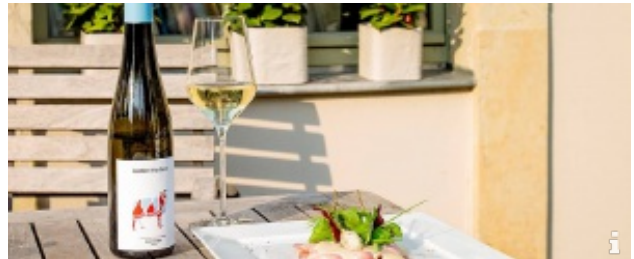
Weingut kastler friedland

Wein und Geschichte im Zentrum der sächsischen Weinkulturlandschaft ▶ weiterlesen