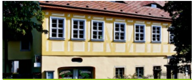
Weingut Haus Steinbach

Wein- und Kulturgenuß im historischen Ambiente