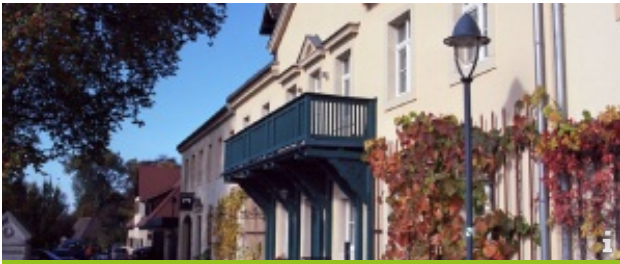
Weingut DREI HERREN

Wein und Kunst im Dialog zwischen Tradition und Moderne