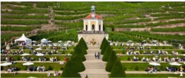
Sächsisches Staatsweingut Schloss Wackerbarth

Weingenuss in einem der kleinsten Weingüter Sachsens ▶ weiterlesen