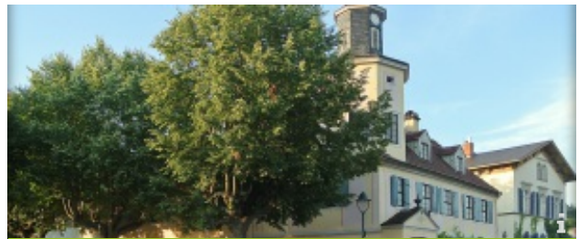
Weingut Karl Friedrich Aust

Willkommen im Reich der Sinne ▶ weiterlesen