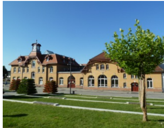
Außenansicht des Radebeuler Kultur-Bahnhofes