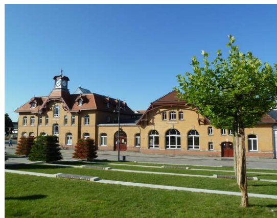
Außenansicht des Radebeuler Kultur-Bahnhofes