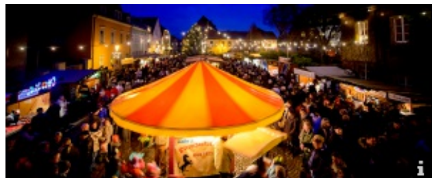
Weihnachtsmarkt "Lichterglanz & Budenzauber"

Weihnachtsfreuden bei Puppenspiel, Märchen, Musik und Winzerglühwein