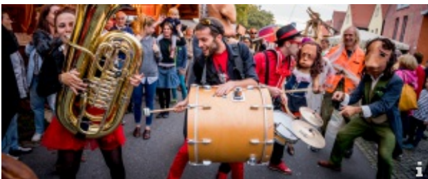
Herbst- & Weinfest mit Internationalem Wandertheaterfestival

Ein Festival für Wein, Theater, Musik, Genuss und Lebensfreude