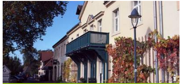
Weingut DREI HERREN

Wein und Kunst im Dialog zwischen Tradition und Moderne