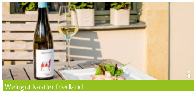
Weingut kastler friedland

Der von einer hohen Mauer geschützte Weinberg auf dem Radebeuler Johannisberg