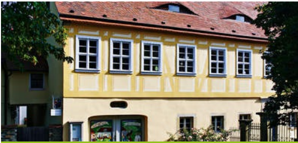
Weingut Haus Steinbach

Entlang der malerischen Radebeuler Elbhänge finden Sie zahlreiche gemütliche Weingüter, die in romantischen Höfen mit erlesenen Weinen und einem eindrucksvollen Ausblick in die Radebeuler Weinberge zum Genießen und Verweilen einladen.