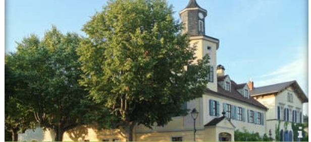
Weingut Karl Friedrich Aust

Weinkultur und Heimatliebe im Herzen der Oberlößnitz