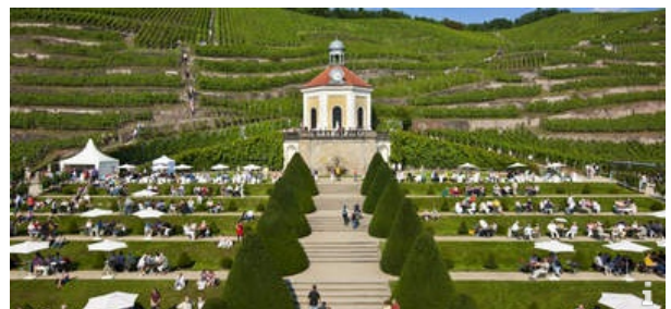
Sächsisches Staatsweingut Schloss Wackerbarth