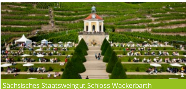
Sächsisches Staatsweingut Schloss Wackerbarth