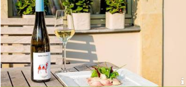
Weingut kastler friedland

Entlang der malerischen Radebeuler Elbhänge finden Sie zahlreiche gemütliche Weingüter, die in romantischen Höfen mit erlesenen Weinen und einem eindrucksvollen Ausblick in die Radebeuler Weinberge zum Genießen und Verweilen einladen.