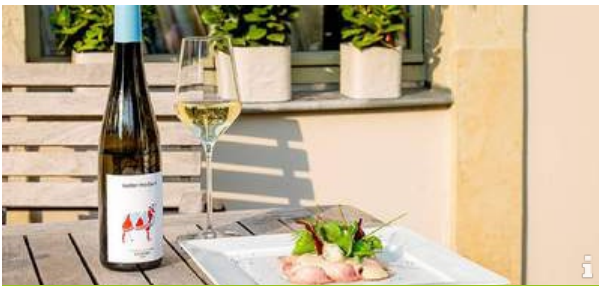
Weingut kastler friedland

Der von einer hohen Mauer geschützte Weinberg auf dem Radebeuler Johannisberg