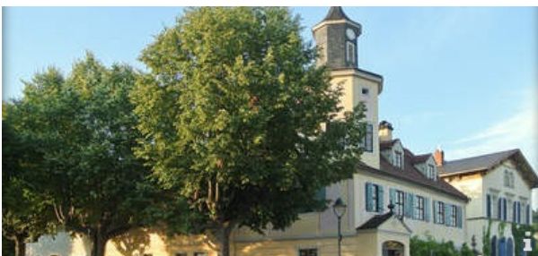
Weingut Karl Friedrich Aust

Weinkultur und Heimatliebe im Herzen der Oberlößnitz