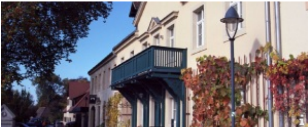
Weingut DREI HERREN

Entlang der malerischen Radebeuler Elbhänge finden Sie zahlreiche gemütliche Weingüter, die in romantischen Höfen mit erlesenen Weinen und einem eindrucksvollen Ausblick in die Radebeuler Weinberge zum Genießen und Verweilen einladen.