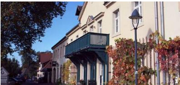
Weingut DREI HERREN

Wein und Kunst im Dialog zwischen Tradition und Moderne