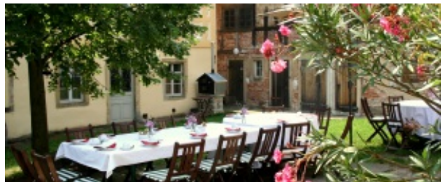
Weingut Haus Steinbach