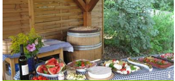
Weinschank an der Finsteren Gasse