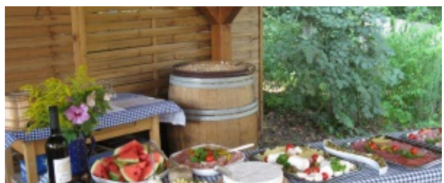
Weinschank an der Finsteren Gasse