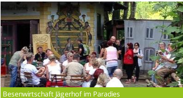
Besenwirtschaft Jägerhof im Paradies