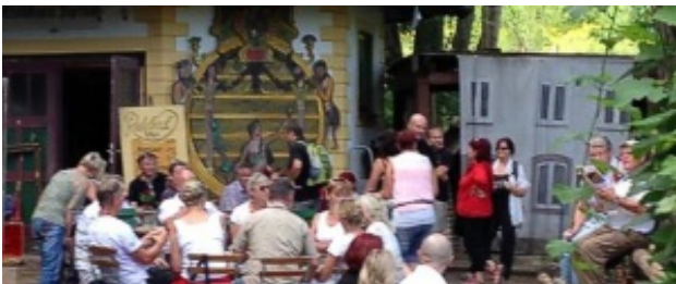
Jägerhof im Paradies