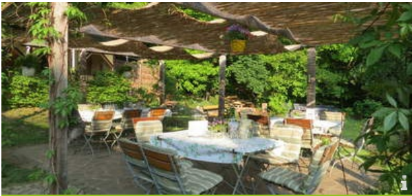
Weinbau Holger Schurig