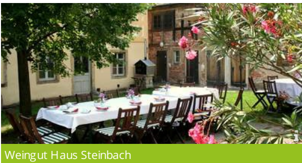
Weingut Haus Steinbach