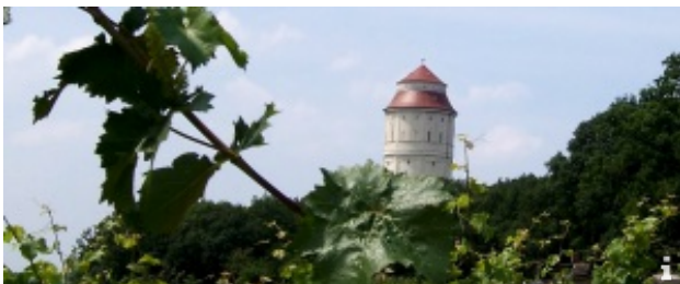
Wanderung durch die Niederlößnitz

Ausgangspunkt Ihrer Wanderung ist die Tourist-Information, an der Haltestelle der Straßenbahnlinie 4 "Landesbühnen..."