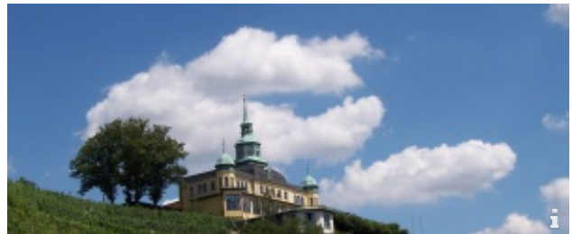
Wanderung zu den Wahnsdorfer Höhen