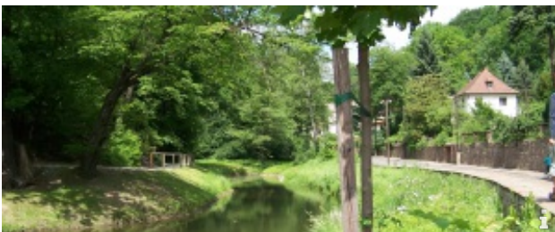
Wanderung durch den Lößnitzgrund