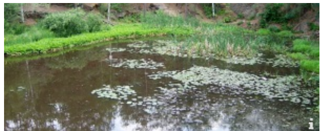
Wanderung zum Seerosenteich