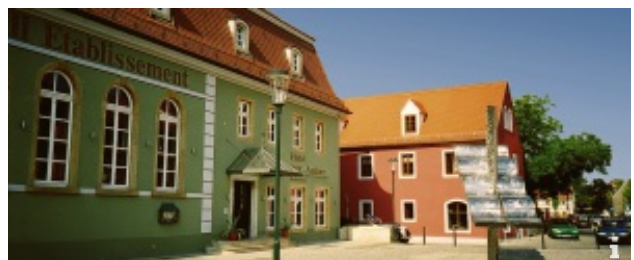
Von Altkötzschenbroda nach Naundorf