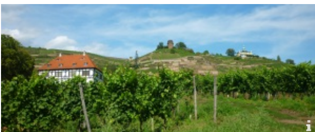
Wanderung durch die Oberlößnitz