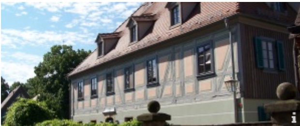
Wanderung durch Zitzschewig

Mit unseren Wandervorschlägen laden wir Sie herzlich ein, unsere wunderschöne Lößnitzlandschaft zu entdecken. Von den grünen Elbauen bis zu den Höhen der Weinberge durch historische Dorfanger und wildromantische Wälder führen viele Wege durch Radebeul. Hier können Sie Ihren Urlaub aktiv gestalten und unsere Kulturlandschaft genießen.