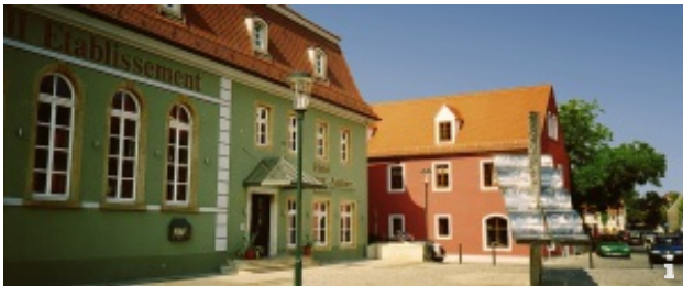
Von Altkötzschenbroda nach Naundorf

Mit unseren Wandervorschlägen laden wir Sie herzlich ein, unsere wunderschöne Lößnitzlandschaft zu entdecken. Von den grünen Elbauen bis zu den Höhen der Weinberge durch historische Dorfanger und wildromantische Wälder führen viele Wege durch Radebeul. Hier können Sie Ihren Urlaub aktiv gestalten und unsere Kulturlandschaft genießen.