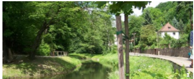
Wanderung durch den Lößnitzgrund