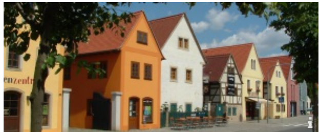
Buntes Wunder Altkötzchenbroda

Führung über den historischen Dorffanger Radebeul-Altkötzchenbroda