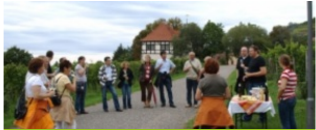
Sächsischer Wander- und Weingenuß

Kulinarische Weinwanderung durch Radebeul-Oberlöbnitz