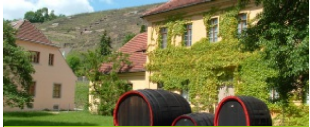
Oberlößnitz - Auf den Spuren der Winzer

Führung entlang der Weinberge in der Radebeuler Oberlößnitz