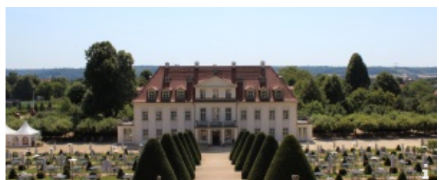
Erlebnis Sächsische Weinstraße

Köstlicher Streifzug durch eines der kleinsten Weinanbaugebiete Deutschlands