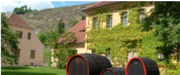
Oberlöbnitz - Auf den Spuren der Winzer

Führung entlang der Weinberge in der Radebeuler Oberlöbnitz