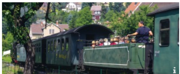
Weingenuss auf schmaler Spur

Ein Ausflug, für den es immer einen Anlass gibt