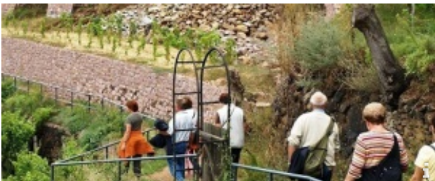
Sächsischer Wander- und Weingenuß

Kulinarische Weinwanderung durch Radebeul-Oberlöbnitz