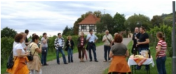
Sächsischer Wander- und Weingenuss

Kulinarische Weinwanderung durch Radebeul-Oberlößnitz