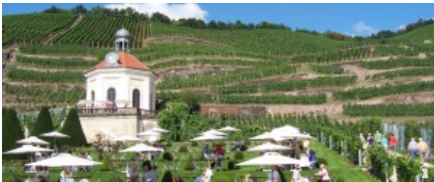
Aus Weinfässern nippen, entlang Sachsens Klippen