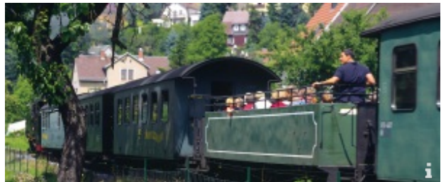
Weingenuß auf schmaler Spur

Ein Ausflug, für den es immer einen Anlass gibt