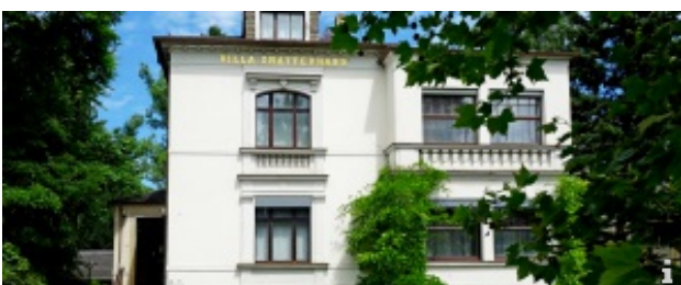
"Auf Karl Mays Spuren"

Spaziergang zu den wichtigsten Wirkungsstätten Karl Mays