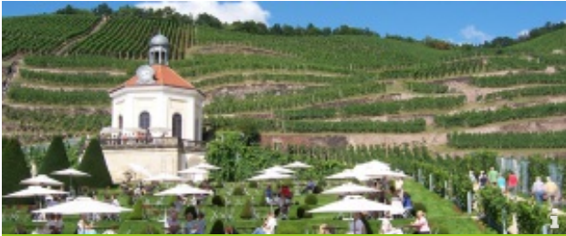
Aus Weinfässern nippen, entlang Sachsens Klippen