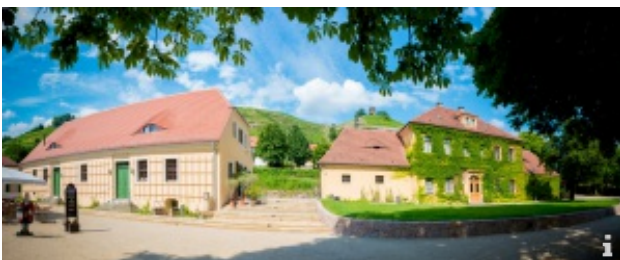
Oberlöbnitz - Auf den Spuren der Winzer

Führung entlang der Weinberge in der Radebeuler Oberlöbnitz